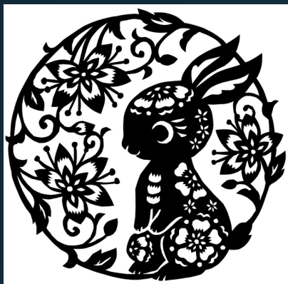
↑うさぎの せんし 剪紙(切り紙)